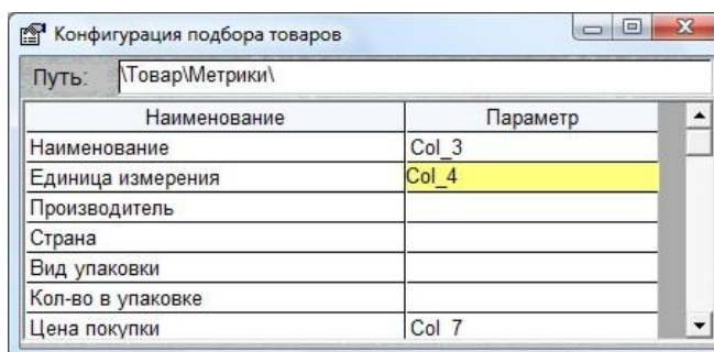
Рис.4.15. Форма «Конфигурация подбора из Excel»

Заполнение всех параметров необязательно, но только заполненные параметры и будут подставляться в характеристики товара.